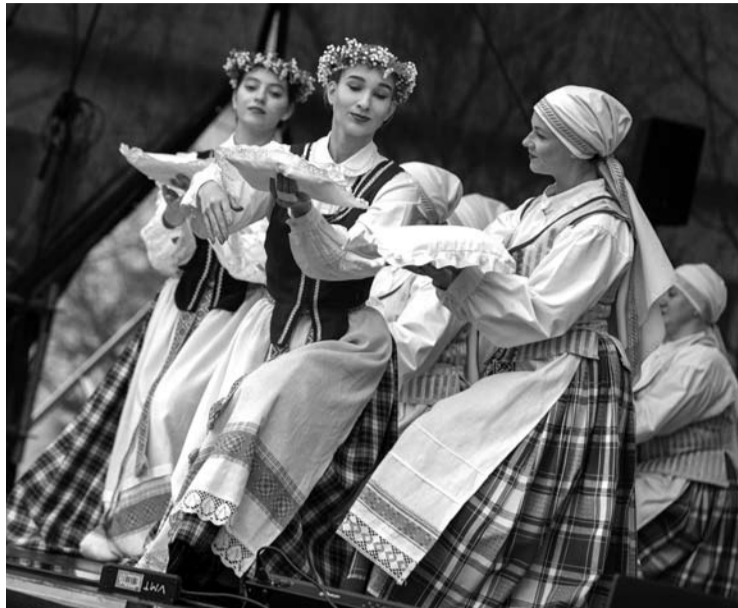
Niūrią dieną žiūrovų akis džiugino tautinių drabužių mozaika.

Daugiausia inkilų pagamino Anykščių J. Biliūno gimnazijos mokiniai ir darželio „Žilvitis“ vaikai. Pasak direktorės, žmonės noriai prisijungė prie šios akcijos – inkilus vežė ir iš bendruomenių, kultūros įstaigų, taip pat inkilus gamino ir ko-