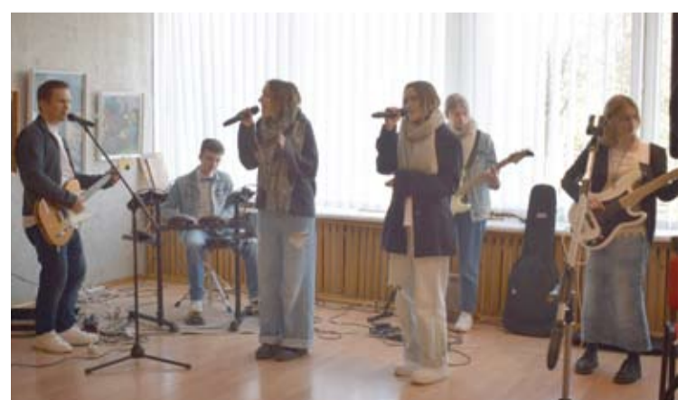
Koncertuoja grupė „Pragiedruliai“.